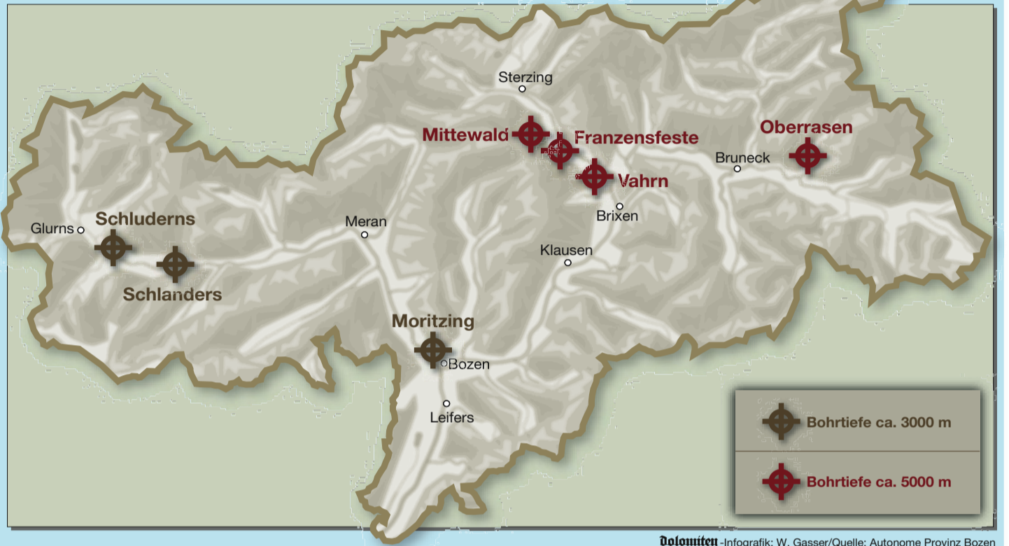
Dolomiten - Infografik: W. Gasser

angetrieben werden. In Vahrn, Franzensfeste, Mittewald und Oberrasen sind solche geothermischen Kraftwerke geplant. „Pro Anlage könnten 2000 Kilowatt pro Stunde gewonnen werden“, so Rauch. Weil die Anlage im Gegensatz zu Windkraftwerken und Solaranlagen rund um die Uhr in Betrieb sei, käme man auf eine Jahresproduktion von 17,4 Mio. Kw/h, die vom Staat auf 15 Jahre zum garantierten Fixpreis von 22 Cent je Kw/h abge-golten werden.